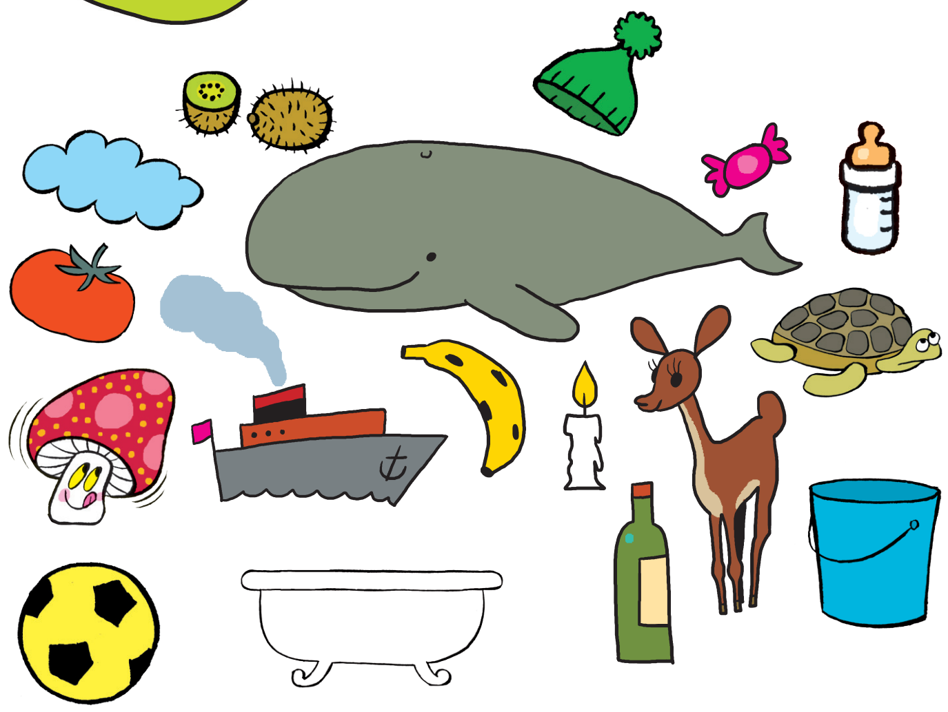
Nuage, tomate, tortue, champignon, kiwi, seau.