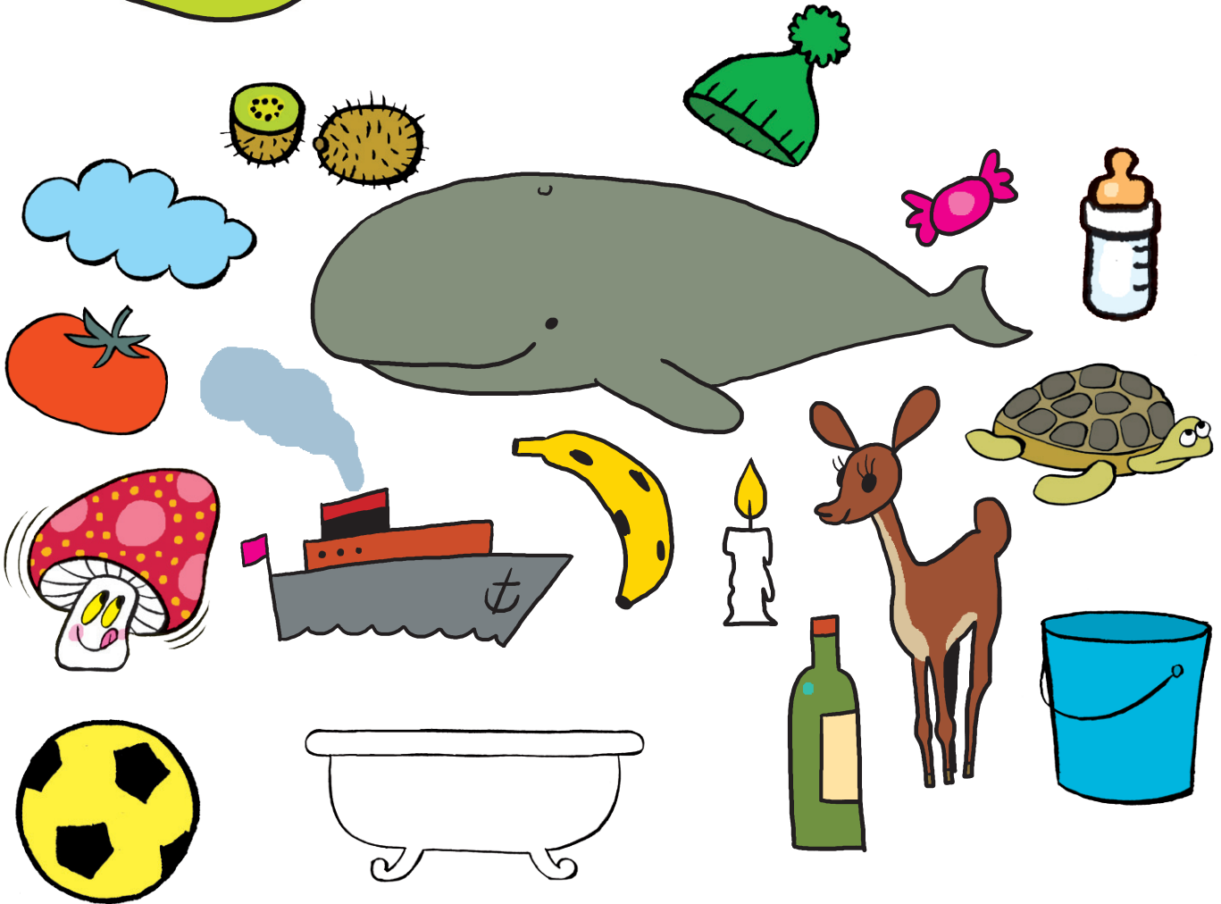
Nuage, tomate, tortue, champignon, kiwi, seau.